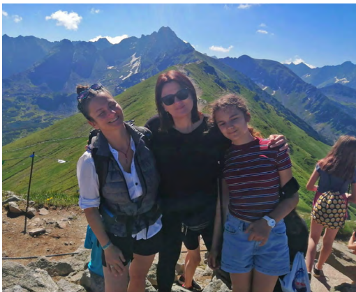
Wychowankowie placówki w Skorogoszczu na wakacjach

Placówka w Skorogoszczu przyznane przez Fundację środki przeznaczyła na dofinansowanie letniego wypoczynku dla dzieci oraz na organizację imprez okolicznościowych. Zakupiono także budki lęgowe dla ptaków, które powieszono w parku otaczającym placówkę. Fundacja Sanktuarium Góra Św. Anny kontynuowała natomiast prace restauratorskie zabytkowych kaplic na terenie Bazyliki św. Anny i zabytkowej Kalwarii.