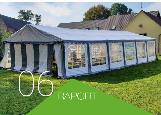
Namiot rekreacyjny w Chrzowicach

Stowarzyszenie „Lepsza Przyszłość w Głębinowie” z pomocą Fundacji kontynuowało prace związane z zagospodarowaniem placu wiejskiego. Wykonano nawierzchnię z kostki brukowej przy siłowni zewnętrznej i przeprowadzono prace związane z utwardzeniem placu. Rok wcześniej, w sołectwie Głębinów Fundacja sfinansowała zakup i montaż urządzeń do siłowni zewnętrznej.