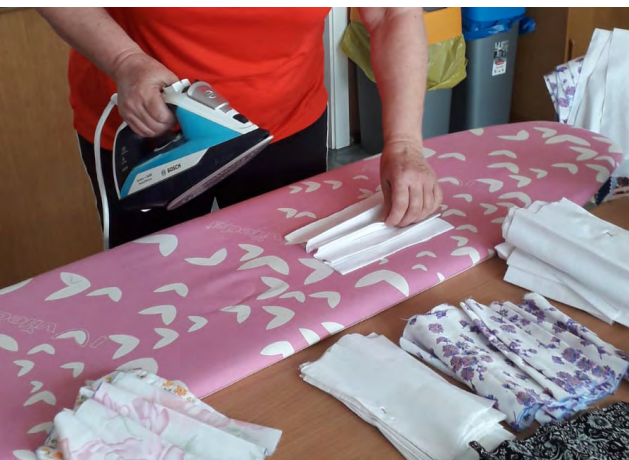
Szycie maseczek w sołectwie Malnia

Jemielnica, OSP Bielice, OSP Wójcice, OSP Dziergowice, OSP Budziska i OSP Parzniewice (pow. Piotrków Trybunalski). Ochotnicza Straż Pożarna w Odrowążu z pozyskanych od Fundacji środków zakupiła wyposażenie, które okazało się pomocne w przygotowaniu miejsc kwarantanny: śpiwory, łóżka polowe, najjaśniejszą akumulatorową, nagrzewnicę olejową oraz czujniki tlenu węgla.