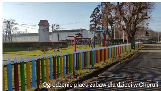
Ogrodzenie placu zabaw dla dzieci w Choruli

Stowarzyszenie „Lepsza Przyszłość w Głębinowie” z pomocą Fundacji kontynuowało prace związane z zagospodarowaniem placu wiejskiego. Wykonano nawierzchnię z kostki brukowej przy siłowni zewnętrznej i przeprowadzono prace związane z utwardzeniem placu. Rok wcześniej, w sołectwie Głębinów Fundacja sfinansowała zakup i montaż urządzeń do siłowni zewnętrznej.