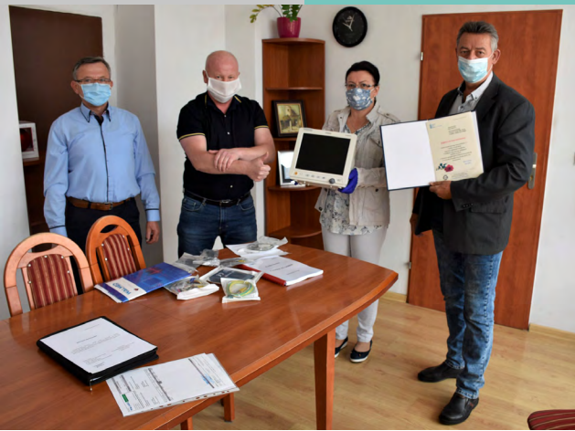
Przekazanie kardiomonitora Powiatowemu Centrum Zdrowia w Lwówku Śląskim

moc trafiła m.in. do Domu Spokojnej Starości „Św. Barbara” w Kamionku i do Opolskiego Hospicjum „Betania”. Dotacje przeznaczono na zakup sprzętu medycznego (koncentratory tlenowe, ozonatory, jonizatory) oraz środków dezynfekujących i środków ochrony indywidualnej. Ze wsparcia skorzystały też dwa ośrodki pomocy społecznej w Krapkowicach, jak również Stowarzyszenie Pomocy Wzajemnej Barka w Strzelcach Opolskich.