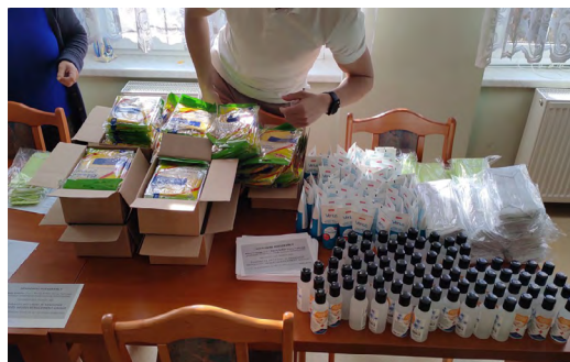
Rozdział środków dezynfekcyjnych w sołectwie Chorula

Część dofinansowania przeznaczono na zakup środków ochrony indywidualnej dla Zakładu Opiekuńczo-Leczniczego w Górażdżach, miejscowego przedszkola oraz kościoła. Również Stowarzyszenie „Wykuwamy Przyszłość” działające w Sołectwie Chorula otrzymało fundusze na zakup środków ochrony indywidualnej i dezynfekujących. Zakupione materiały zostały podzielone na paczki i prze-