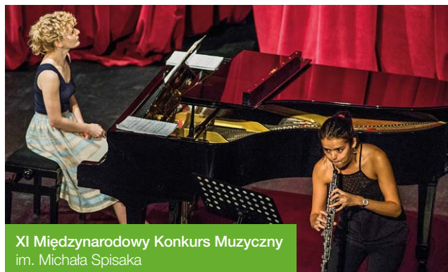
XI Międzynarodowy Konkurs Muzyczny im. Michała Spisaka