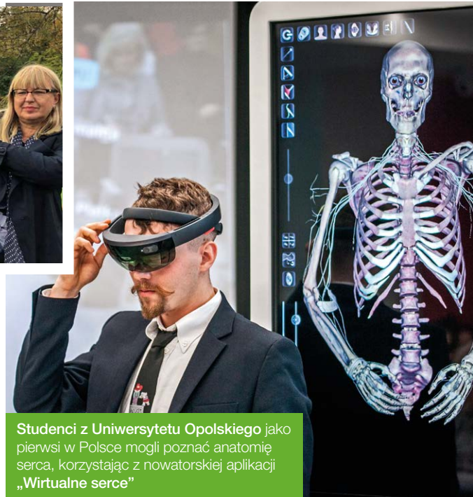
Studenci z Uniwersytetu Opolskiego jako pierwsi w Polsce mogli poznać anatomię serca, korzystając z nowatorskiej aplikacji „Wirtualne serce”

www.aktyniwniwnregionie.pl/pl/granty2017