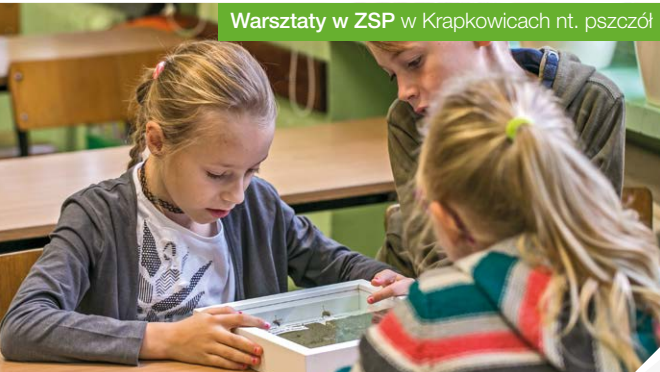
Warsztaty w ZSP w Krapkowicach nt. pszczół